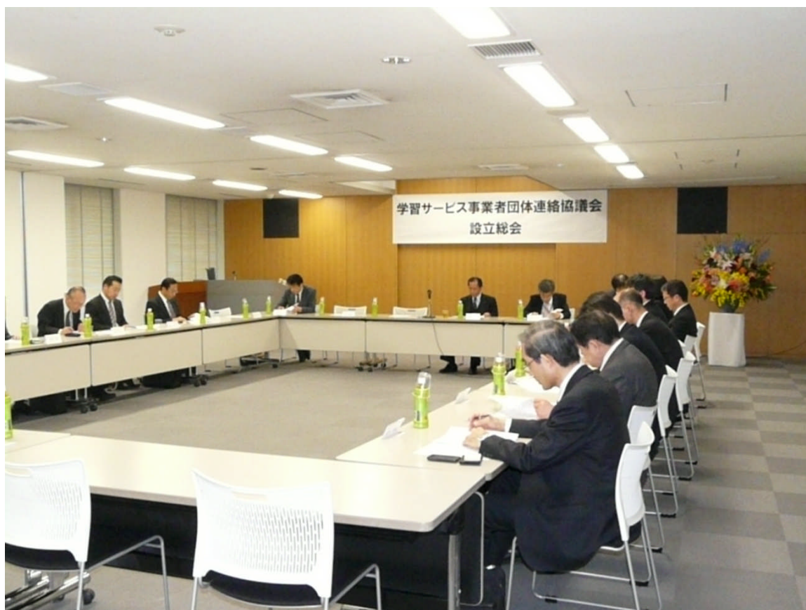
学習サービス事業者団体連絡協議会 設立総会において