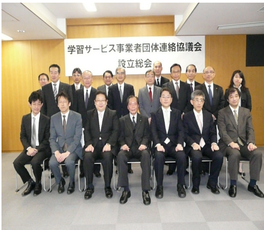
学習サービス事業者団体連絡協議会 設立総会において

●本リリースに関するお問い合わせ先 一般社団法人 人材育成と教育サービス協議会 (JAMOTE) 担当 : 麻野・大石 TEL : 050-7530-3988 Mail : info@jamote.jp URL : http://www.jamote.jp/